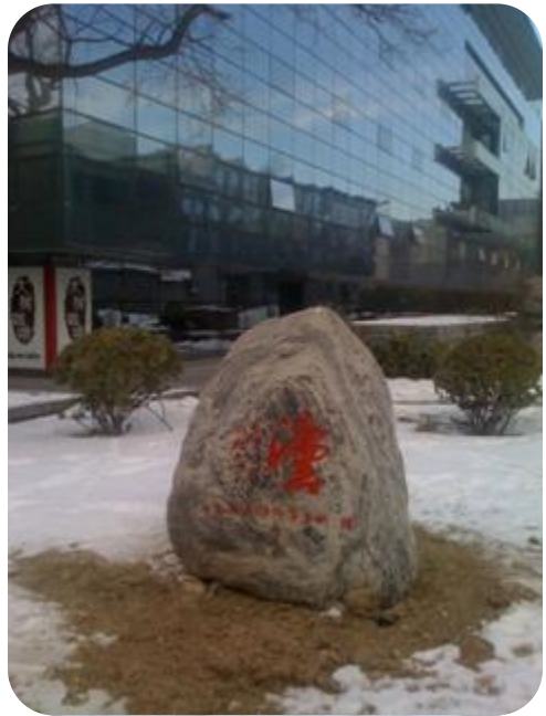
北京岳成律师事务所向北大法学院捐赠泰山石

2009 年 11 月，为庆祝北京大学法学院建院 105 周年，北京岳成律师事务所向我院捐赠一块由著名书法家张飏亲笔题词的泰山石。该石座落于法学院科研楼与四合院之间，石身上所书的篆体“法”字，苍劲有力，雄健洒脱，配以泰山石固有的古朴、苍劲、凝重格调，寄寓了北京大学法学院作为我国现代法学教育的发源地，百余年来秉承“法以育人、法以治国”的治学理念，心系国家，勤勉育人，为社会各界输送了大批优秀人才，为我国法学研究、法学教育的发展做出了突出贡献，堪称我国现代法学教育的领军人。