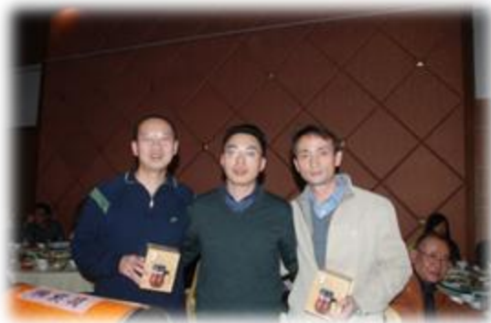
图2 2010年北大广州校友新春嘉年华活动：咱哥三个也来一张