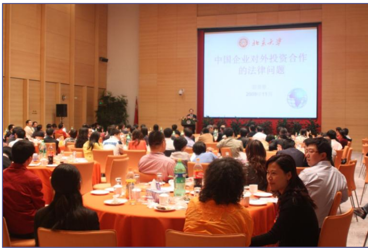
图1 北大法律人上海盛会活动现场