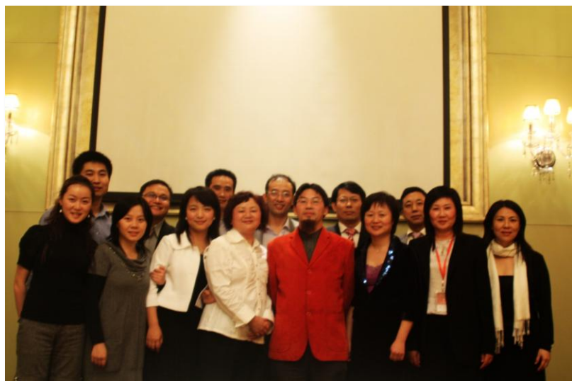
图4 与会校友合影留念

“北大法学上海论坛”是由北京大学法学院主办的学术性论坛，发挥该学院的学科优势与学术成果，以法学前沿理论与法律实务应用为核心，搭建学院与上海各界交流与合作的平台。今后，该论坛将每年举办一至二次，并拓展至北京、广州、深圳等地。