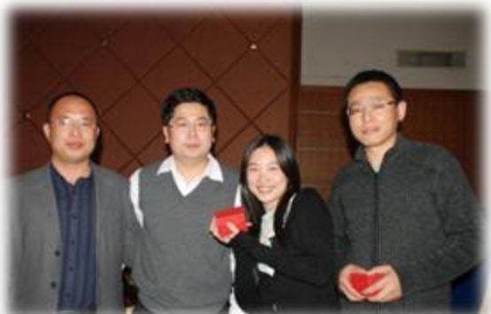
图3 2010年北大广州校友新春嘉年华活动