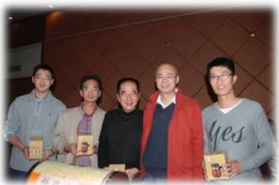
图1 2010年北大广州校友新春嘉年华活动：新老校友齐聚抽奖乐开怀

时校友还携带家属参加，大家共聚一堂，共享新年祝福。（文：陈平健、林海光、易云卿）